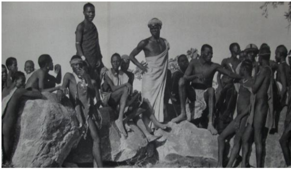
Peuple animiste de l'extrême Nord, Ouvert à l'Évangile

La province du Cameroun célèbre en cette année 2021, ses 75 ans de présence et d'action missionnaire sous le thème « Avançons au large avec espérance ».